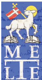
MELTE Magyarországi Egyházi Levéltárosok Egyesülete